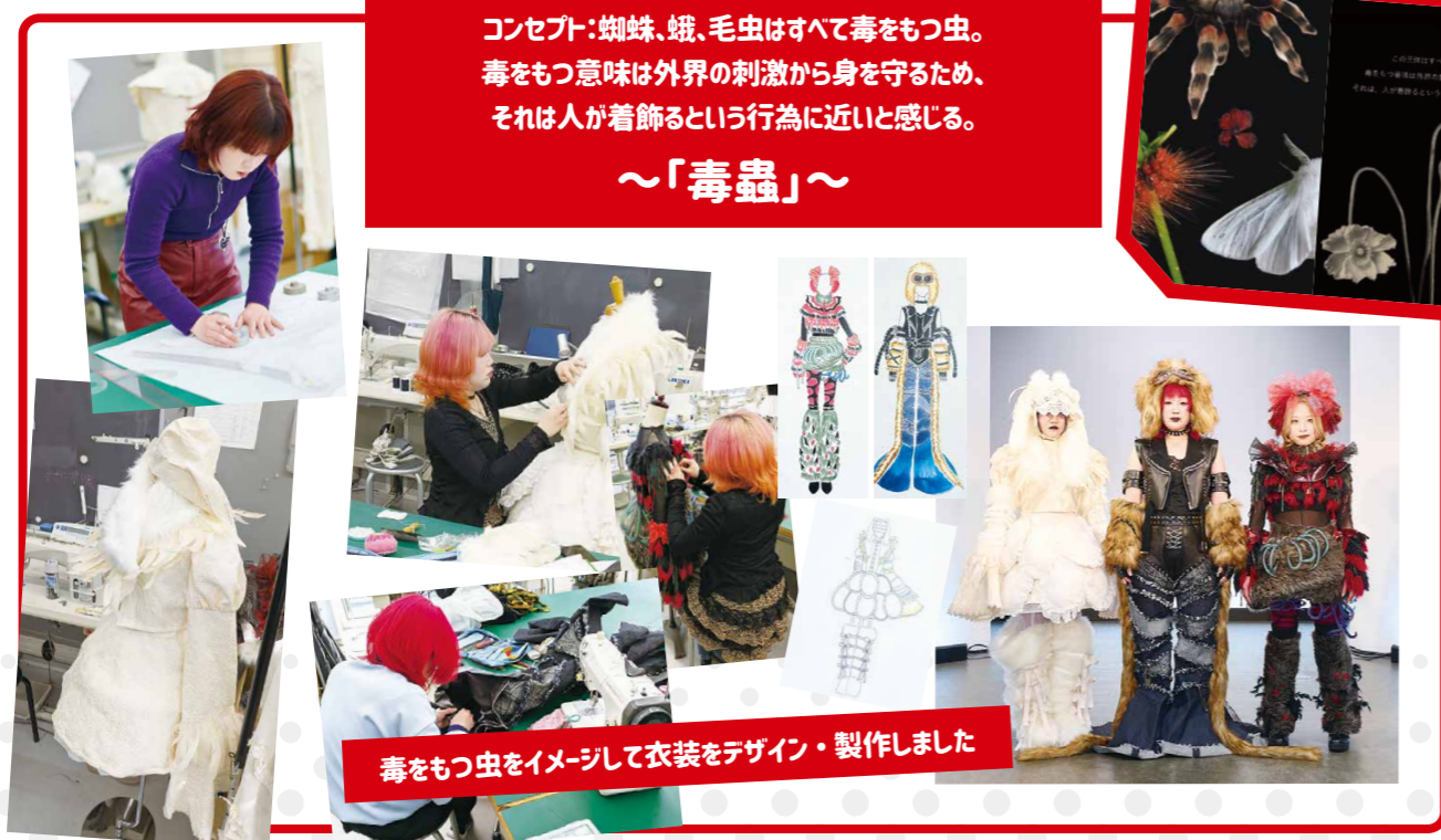
毒をもつ虫をイメージして衣装をデザイン・製作しました