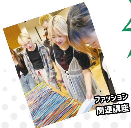
ファッション 関連講座