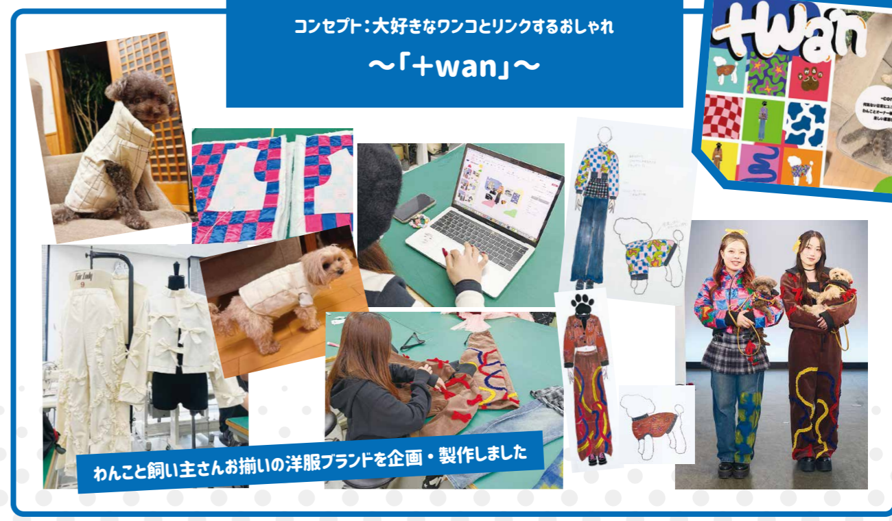
わんこ飼い主さんお揃いの洋服ブランドを企画・製作しました