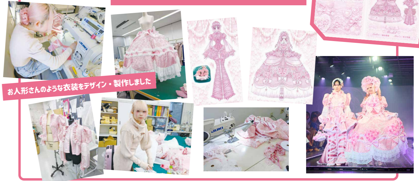
お人形さんのような衣装をデザイン・製作しました