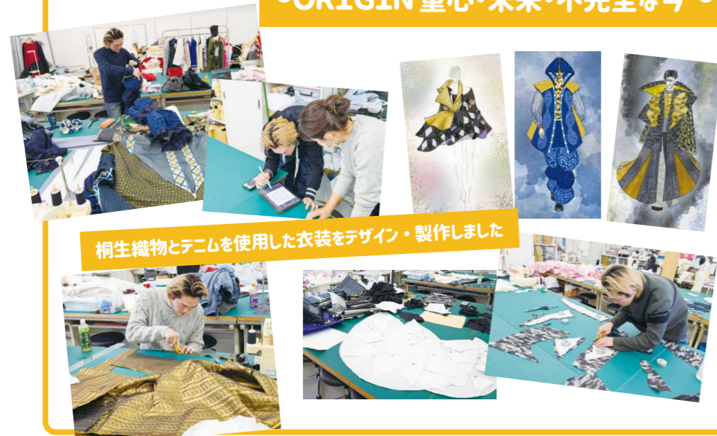
桐生織物とデコムを使用した衣装をデザイン・製作しました